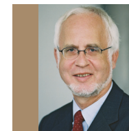
Wolf-Michael Catenhusen Staatssekretär des Bundesministeriums für Bildung und Forschung